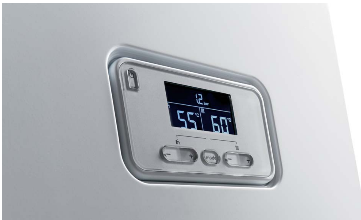
Jednoduchý ovládací panel pro snadnou obsluhu s podsvíceným displejem